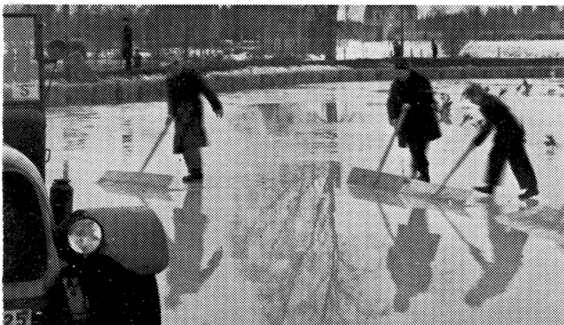
En tävlingsledares besvärligheter

för aldrig tidigare har väl en sådan tävlingsiver varit rådande som nu. Klubben startade efter kriget som medlem av SMK, men många hade gamla TMK kärt och därför lämnades SMK ganska snart. I SVEMO har TMK varit medlem sedan denna organisation började och på senare tid har TMK även ingått som medlem i KAK:s landsförbund.