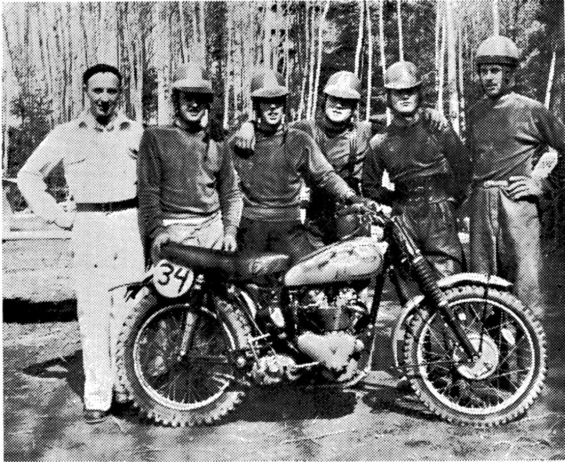
Från seriematchen i Skara 1 maj 1953 då Tibro blev första lag, slående Skara och Trollhättan.